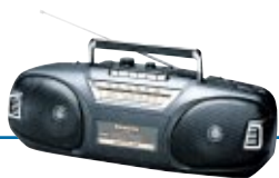
Retención de Llamada