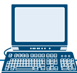
Acceso a la Computadora Personal