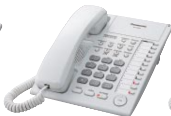
■ KX-T7720 Unidad con Altavoz