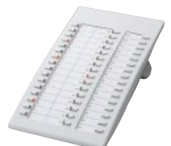
■ KX-T7740 Consola DSS