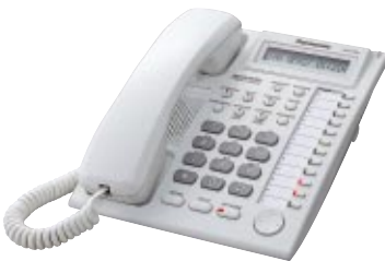
■ KX-T7730 Unidad con LCD y Altavoz